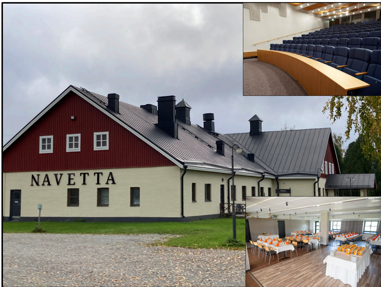
Hyvärilän Navetta-rakennuksessa sijaitsevat juhlatila ja auditorio

Osallistumisestaan sukupäiville on ilmoitettava 15.6.2024 mennessä, sillä Hyvärilälle on ilmoitettava osallistujien määrä viimeistään 20.6. Koko paketin; lounas, kokous ja illallinen, hinnaksi päätettiin seuran jäsenille 80 € ja muille 95 €. Ilman illallista hinta on 50 € ja 65 €. Hinta maksetaan etukäteen.