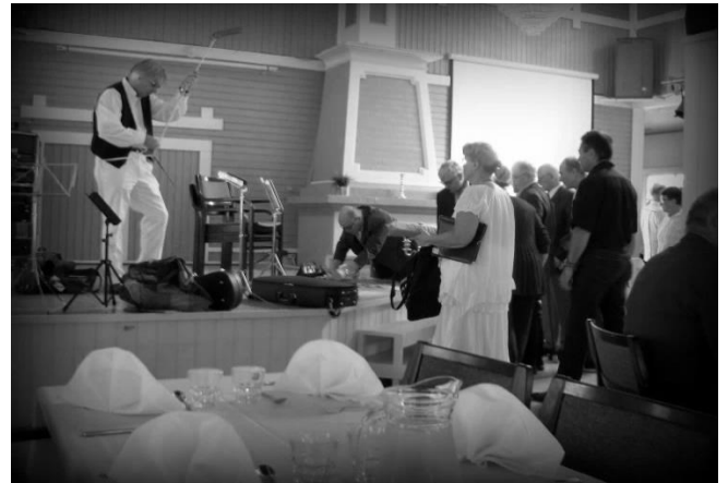
Senkka-orkesteri viritteli piuhoja musiikkia varten