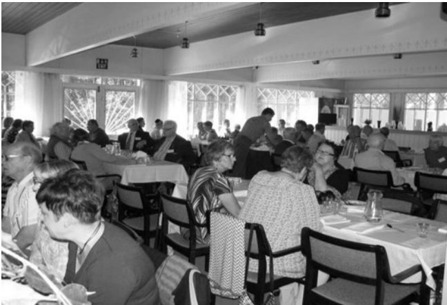
Kasinon juhlasali täyttyi Saarelaisista