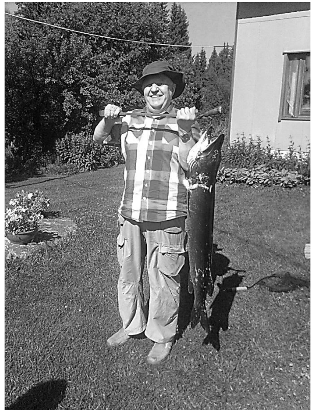
Pitkällä siimalla saatu hauki, paino 8,9 kg, pituutta 114 cm, ympärysmitta 43 cm. Syrjälampi 12.07.2014