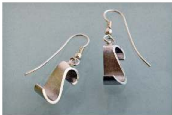
3. S-korvakoukut á 110€