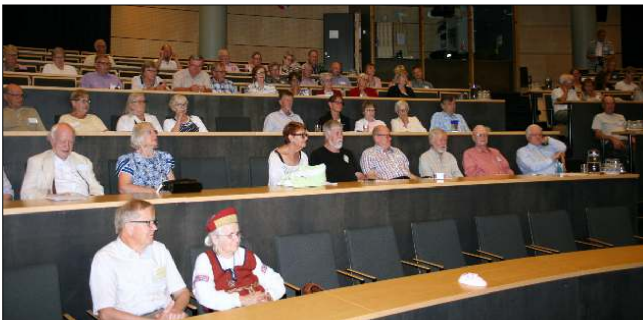
Kolin luontokeskuksen auditorio oli Saarelaisten käytössä sukupäivien ajan.

Saarelaisten sukuseura juhli 28.7.2018 seitsemänsiä sukupäiviään Kolilla, Luontokeskus Ukossa. Mikä paikka olisikaan sopinut sukupäivien pitopaikaksi paremmin kuin Koli, olimmehan sukuseuran syntysijoilla ja satavuotiaan Suomen kansallismaisemissa. Eikä tämä suinkaan ollut ensimmäinen kokoontuminen Lieksassa, vaan peräti kolmas kerta, kuten totesin avatessani sukupäivät.