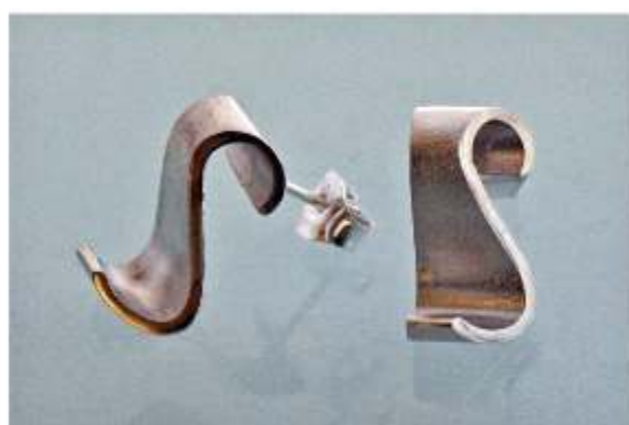
4. S-tappikorvakorut á 110€