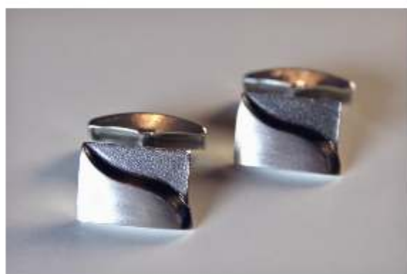
5. Saari-kalvosinnapit á 125€