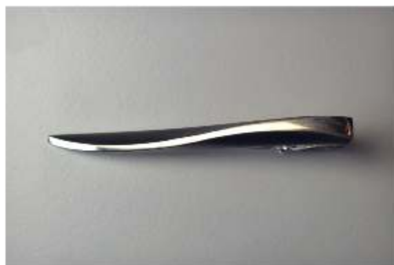
6. Saari-solmioneula á 115€

Koruja voi tilata Kalevi Saarelaiselta osoite: Ruonasalmentie 10 b, 00830 Helsinki puh. 0400 467 003 E-mail: kalevi.saarelainen(at)herdesign.fi