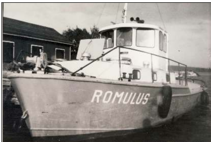
Romulus-hinaaja Lastukosken laiturissa. Romulus toimii nykyisin Varkauden järvipelastusseuran aluksena.

Olin kolmannella vuodella, kun muutimme Varpaisjärven Itäkoskelle. Isä pestattiin myläriksi kosken kupeella sijain-