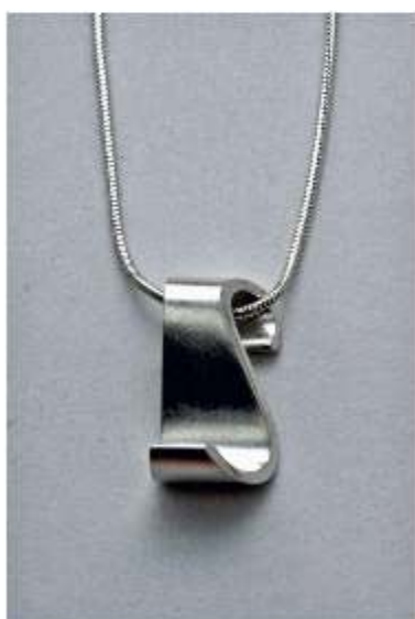
2. S-riipus á 65€