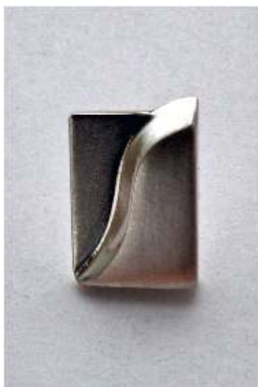
1. Saari-pinssi á 36€