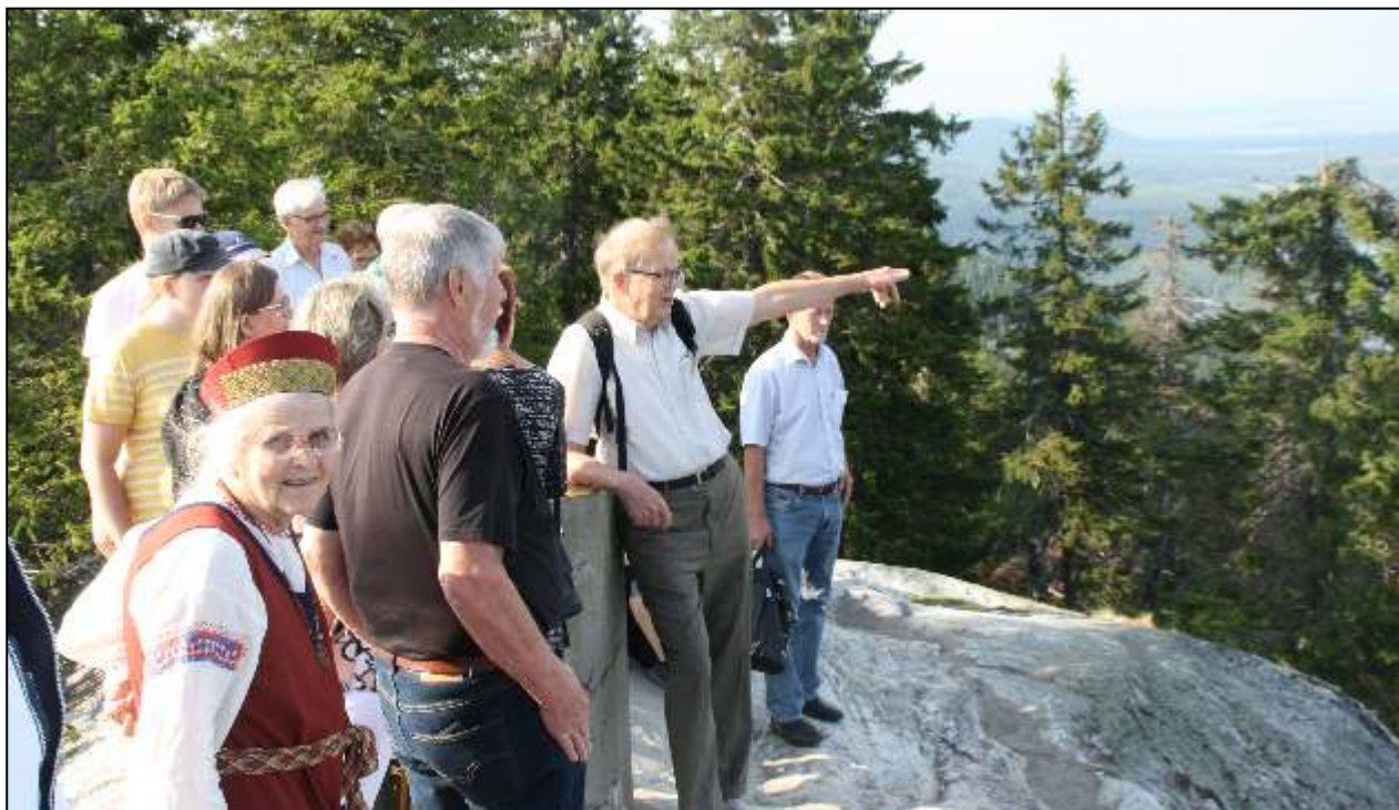
Kolin kallioista ja maisemista kuultiin Ilmarilta monia mielenkiintoisia yksityiskohtia.

kotikaupungissaan. Kolmen pienen lapsen isä ehtii osallistua muun muassa kunnallispolitiikkaan. Hän on kaupunginvaltuutettu ja evankelis-luterilaisen seurakunnan kirkkovaltuuston puheenjohtaja. Harrastuksiin kuuluu lisäksi puutarhanhoito ja näytteleminen Lieksan teatterissa. Hän kerää kolikoita ja postimerkkejä ja harrastaa myös murrसानojen muistiin merkitsemistä. Ja kiinnostuksen kohteina ovat myös omat juuret, sukulaiset ja sukuseuran toiminta.