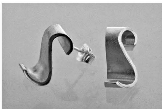
4. S-tappikorvakorut á 110€