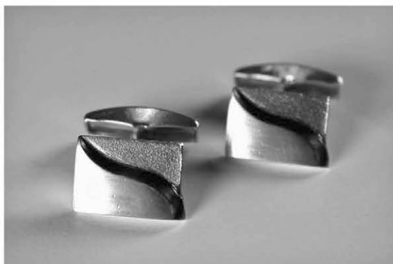
5. Saari-kalvosinnapit á 125€