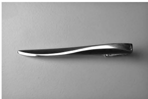
6. Saari-solmioneula á 115€