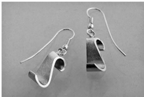
3. S-korvakoukut á 110€