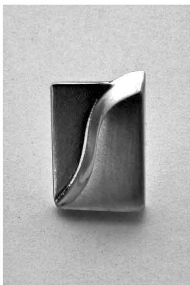
1. Saari-pinssi á 36€