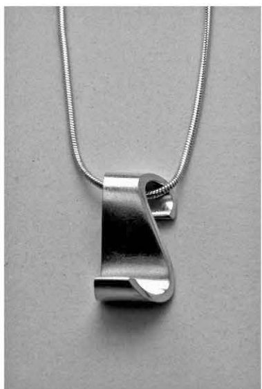
2. S-riipus á 65€