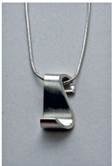
2. S-riipus á 65€