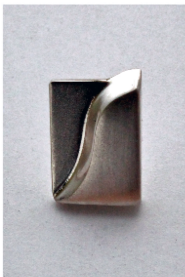
1. Saari-pinssi á 36€