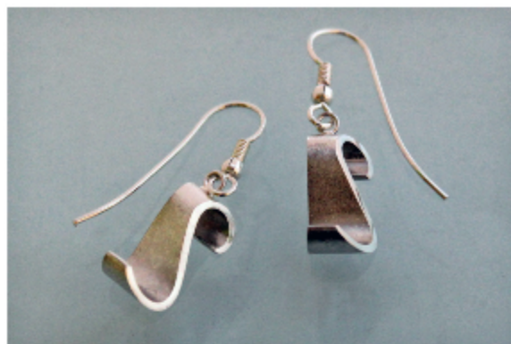
3. S-korvakoukut á 110€