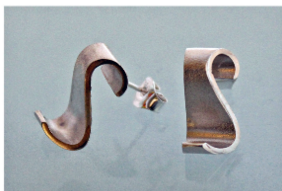
4. S-tappikorvakorut á 110€