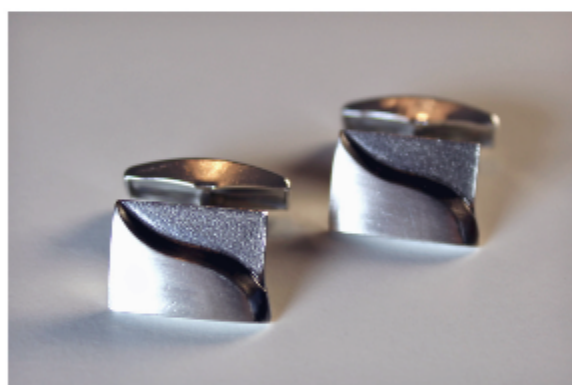
5. Saari-kalvosinnapit á 125€