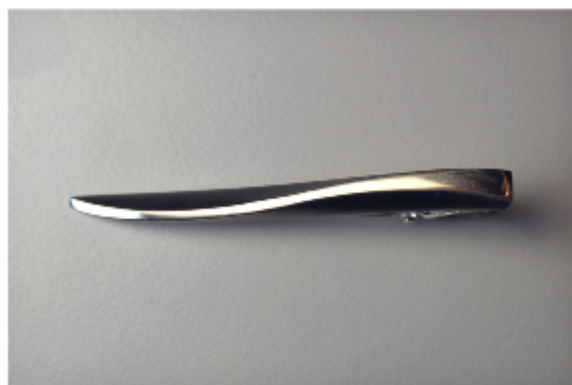
6. Saari-solmioneula á 115€

Koruja voi tilata Kalevi Saarelaiselta osoite: Ruonasalmentie 10 b, 00830 Helsinki puh. 0400 467 003 E-mail: kalevi.saarelainen(at)herdesign.fi