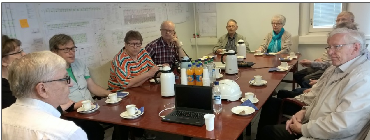
Kesäretkeläisiä Betonimestareiden Iisalmen tehtaalla

Teksti ja kuvat: Kalevi Saarelainen, pj.