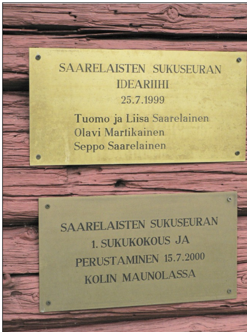
Saarelaisten sukuseuran alkuvaiheiden muistolaatat Kolin Maunolan aitan seinässä.